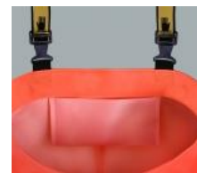
胴体前部に内ポケット付 (大きさ: 300 x 160 mm)