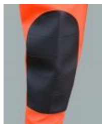
追加補強された膝部