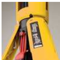
操作しやすいワンタッチロック