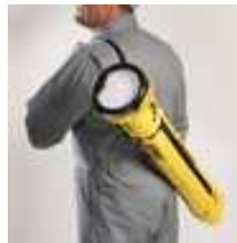
軽量で持ち運びも簡単