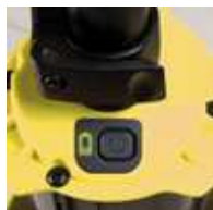
バッテリー残量が見えるスイッチ部